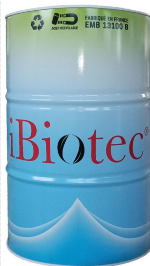
200 L tønde